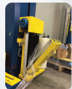
FILM CARRIAGE with POWER PRE-STRETCH (200 % FIXED RATIO)