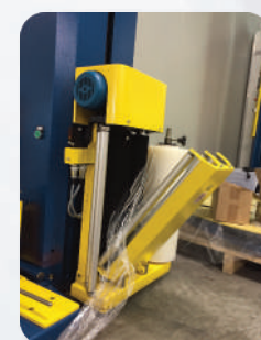
CARRELLO PORTA BOBINA con PRESTIRO 200% e TENSIONAMENTO FISSO